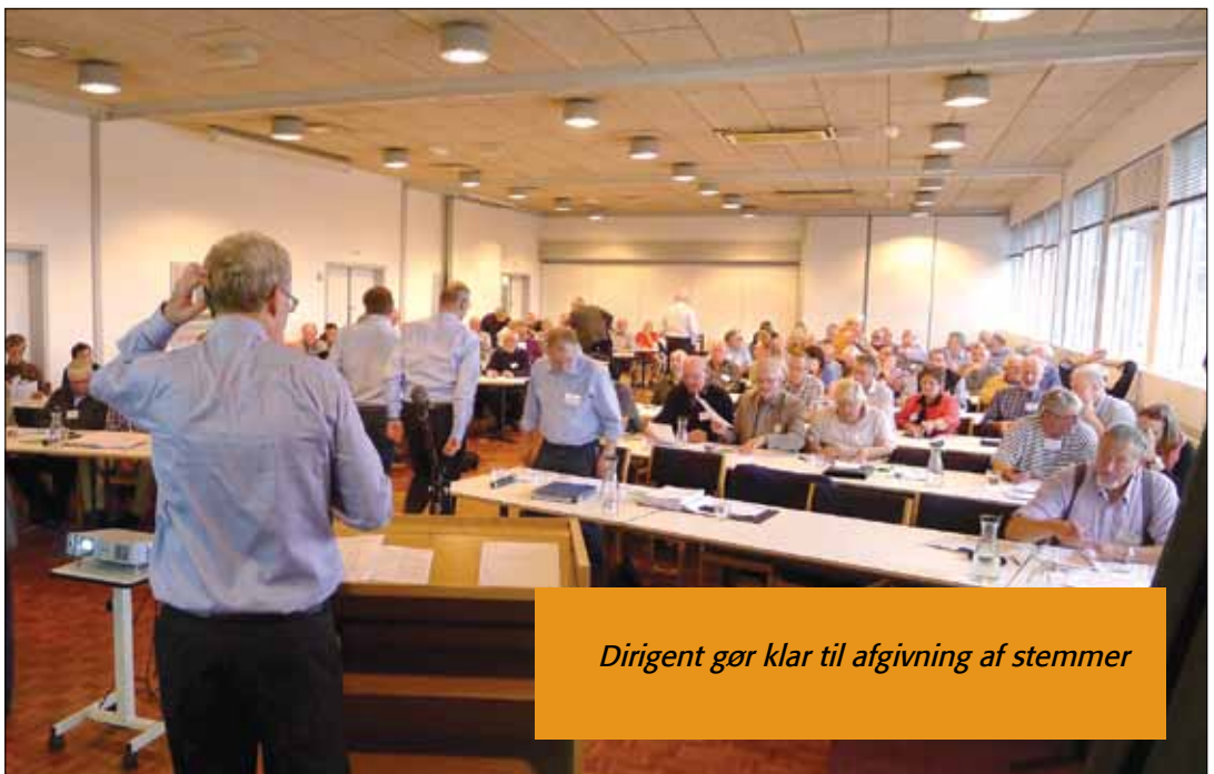
Dirigent gør klar til afgivning af stemmer

Sv: Hovedbestyrelsen havde forespurgt om